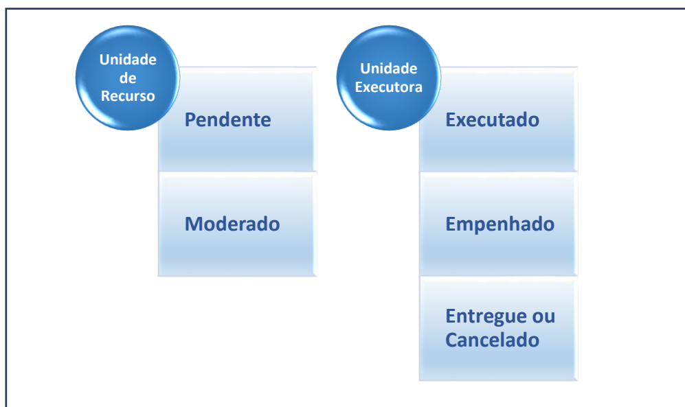
Tipos de Status de Pedidos

Assim como no planejamento, o status de um pedido inteiro se diferencia dos status de cada um de seus itens e o status do pedido só altera quando a ação foi realizada para todos eles.